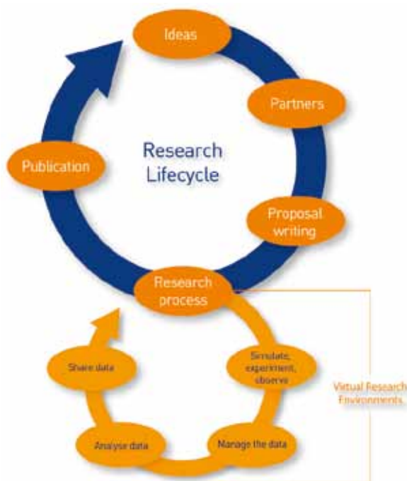
Abbildung 1: Research-Life-Cycle; übernommen von http://www.jisc.ac.uk/whatwedo/campaigns/res3/jischelp.aspx

Da die Massen an wissenschaftlichen Daten rapide wachsen und die Anforderungen an die digitalen Umgebungen, in denen Sie verarbeitet werden immer komplexer werden, kämpft die Wissenschaft augenblicklich um eine gemeinsame Infrastruktur zur