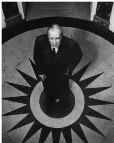
Borges, Jorge Luis (1899–1986) Schriftsteller und Direktor der argentinischen Nationalbibliothek.

Foto 1969. Wikipedia. (Folgende Abbildungen aus Wikipedia sind, wenn nicht anders angegeben, gemeinfrei.)