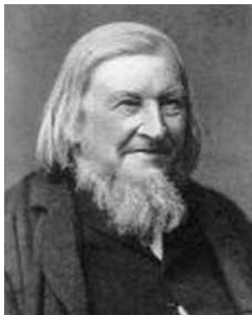
Hoffmann von Fallersleben, August Heinrich (1798–1874) Hochschullehrer, Dichter, Kustos der Universitätsbibliothek Breslau, Bibliothekar auf Schloss Corvey.