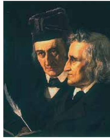
Brüder Grimm, Jacob (1785–1863) und Wilhelm (1786–1859) Sprachwissenschaftler, Volkskundler, Märchensammler, Bibliothekare in Kassel und Göttingen.