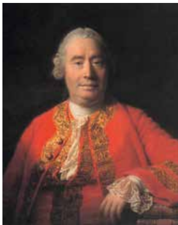
Hume, David (1711–1776) Philosoph, Ökonom, Historiker; Bibliothekar der Anwaltskammer in Edinburgh.

Mao Zedong (1893–1976) soll als vorübergehende Hilfskraft an der Universitätsbibliothek Beijing (Peking) von dem ihm vorgesetzten Bibliothekar nachhaltig im Sinne des Marxismus beeinflusst worden sein. Als Berufskollegen wird man ihn aber wohl kaum bezeichnen können. Beruhigend ist auch, dass Namen wie Nero, Hitler, Stalin oder Pol Pot im Zusammenhang mit unserem Thema nie auftauchen.