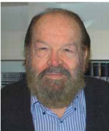
Spencer, Bud (Carlo Pedersoli, 1929–) Schauspieler, Bibliothekar in Buenos Aires.