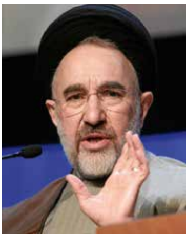
Chatami (Khatami), Mohammad (1943–) Staatspräsident des Iran von 1997 bis 2005, vorher seit 1992 Direktor der Nationalbibliothek in Teheran.