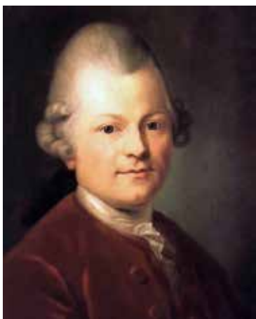
Lessing, Gotthold Ephraim (1729–1781) Dichter, Bibliothekar an der herzoglichen Bibliothek in Wolfenbüttel.

Foto der Büste von Johann Gottfried Schmidt 1788. Gottfried Wilhelm Leibniz Bibliothek, Hannover.