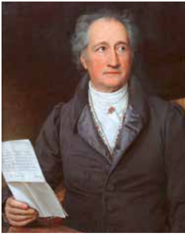
Goethe, Johann Wolfgang (1749–1832) Dichter; als Minister verantwortlich für die Bibliotheken in Weimar und Jena, an deren Arbeit er aktiv beteiligt war.

Viele Statistiken hat der Glossist durchkämmt; das, was er suchte, hat er nicht gefunden – kein Bibliothekar, keine Bibliothekarin, nirgends. Es wäre doch einmal interessant zu erfahren, ob und wer in den verschiedenen Parlamenten des Deutschen Reiches, der DDR und der Bundesrepublik sowie im wiedervereinigten Deutschland aus diesem gemeinhin als friedlich und gebildet geltenden Berufsstand stammte oder stammt.