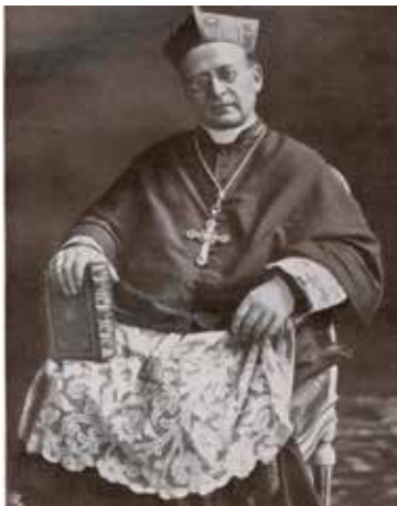
Papst Pius XI. (Achille Ratti, 1857–1939) Bibliothekar Biblioteca Ambrosiana, Mailand, Präfekt der Vatikanischen Bibliothek.