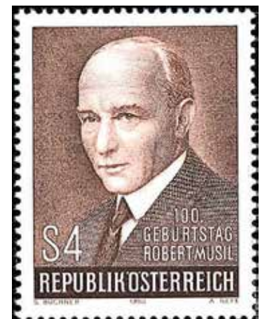
Musil, Robert (1880–1942) Schriftsteller; Bibliothekar an der Technischen Hochschule Wien