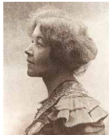
Huch, Ricarda (1864–1947) Schriftstellerin, Historikerin; Bibliothekarin an der Stadtbibliothek Zürich.

Postkarte um 1910/20, entstanden vor 1874. Verlag Albert Frisch, Berlin. Wikipedia.