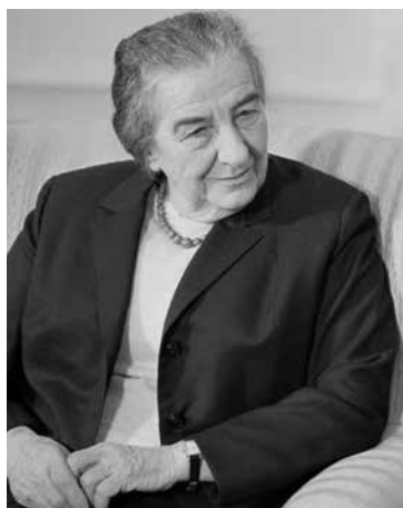
Meir, Golda (1898–1978) Außenministerin und Ministerpräsidentin Israels; Bibliothekarin in Chicago und New York.

Gemälde von Anton Graff 1771. Wikipedia.