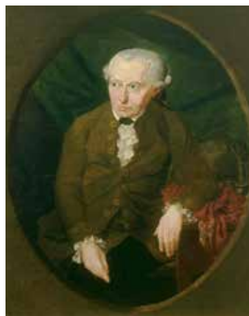
Kant, Immanuel (1724–1804) Philosoph, Unterbibliothekar der königlichen Schlossbibliothek in Königsberg.

Porträt von Allan Ramsay 1766.