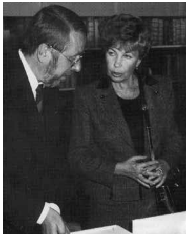
Gorbatschowa, Raissa Maximowna (1932–1999) Ehefrau von Michail Gorbatschow, Generalsekretär des Zentralkomitees der Kommunistischen Partei und Staatspräsident der Sowjetunion. Ende der 50er Jahre Lektorin an der städtischen Bibliothek Stawropol.

Ölgemälde von Joseph Karl Stieler 1828. Wikipedia.