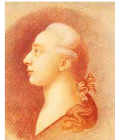
Casanova, Giacomo (1725–1798) Venezianischer Schriftsteller und Abenteurer; seine letzten Lebensjahre verbrachte er als Bibliothekar auf Schloss Duchcov (Dux).

Foto von Krisanna Johnson 2009. Wikipedia.