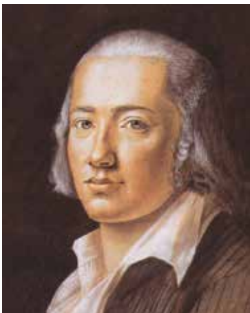
Hölderlin, Friedrich (1770–1843) Dichter, Hofbibliothekar in Homburg.

Doppelporträt der Brüder Wilhelm Grimm (links) und Jacob Grimm von Elisabeth Jerichau-Baumann, 1855.