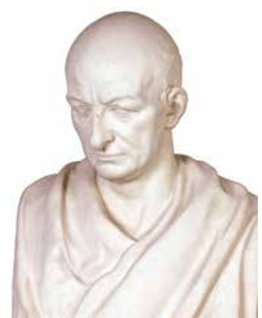
Leibniz, Gottfried Wilhelm (1646–1716) Universalgelehrter, Leiter der Kurfürstlichen Bibliothek in Hannover und der herzoglichen Bibliothek in Wolfenbüttel.