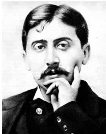
Proust, Marcel Valentin Louis Eugène (1871–1922) Schriftsteller, Bibliothekar in der Bibliothèque Mazarine Paris.