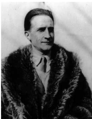
Duchamp, Henri-Robert Marcel (1887–1968) Französisch-US-amerikanischer Maler, seit 1913 Bibliothekar an der Bibliothek Sainte-Geneviève Paris.