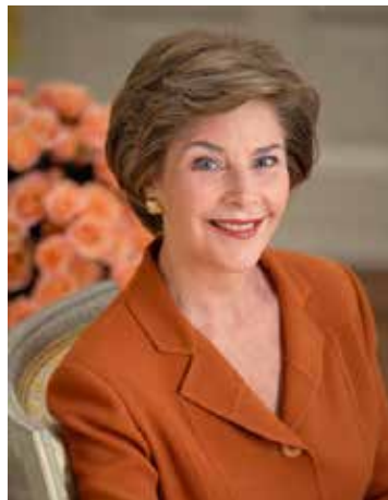
Bush, Laura (1946–) Ehefrau des amerikanischen Präsidenten (2001–2009) George W. Bush, Bibliothekarin in Dallas und Austin.

Foto 1969. Wikipedia. (Folgende Abbildungen aus Wikipedia sind, wenn nicht anders angegeben, gemeinfrei.)