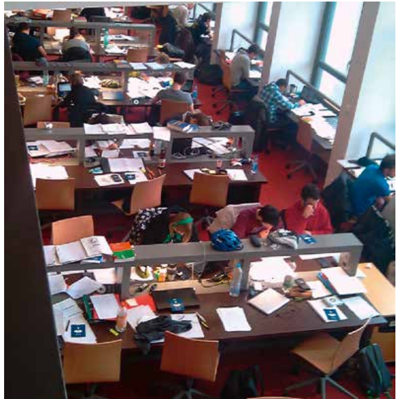
Lesesaal KIT-Bibliothek Süd

Durch diese verstärkte Nutzung von Bibliotheksräumen als Lern- und Arbeitsräume bei Studierenden ändern sich aber auch die Anforderungen an das Bibliothekspersonal im Benutzungsbereich. Bisher wurden die Mitarbeiter und Mitarbeiterinnen dazu ausgebildet, die Kunden beim Stöbern am Bücherregal, Anlesen und Ausleihen von Büchern und bei Fragen zu Katalogrecherchen zu unterstützen. Die Mehrzahl der Studierenden kommt jedoch zum selbstbestimmten Lernen in die Bibliotheksräume. Sie stehen dabei unter anderem vor der Herausforderung, Literatur und andere Informationsquellen aufzufinden, zu bewerten und strukturiert weiterzuverarbeiten. Hilfestellung in