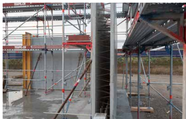
Betonwände mit vorgefertigten Elsässer-Elementen (8.1.2015)