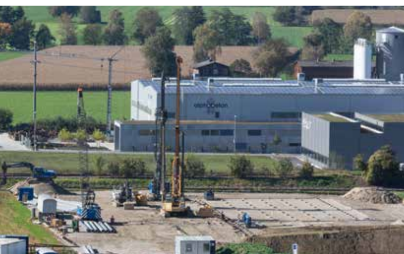
Fundamentierung mit Rammpfählen (19.10.2014,)

Das Magazingebäude ist nicht klimatisiert, die Temperaturen dürfen im Tagesgang um +/- 1°C schwanken und sich im Jahresgang in einem Bereich von +7 bis +17 °C bewegen. Dies wird durch die massive Betonbauweise und die Wärmedämmung gewährleistet. Die relative Luftfeuchtigkeit darf zwischen 35 und 45% betragen, im Falle von zu tiefen Werten kann zusätzlich befeuchtet werden. Sollten sich die Klimawerte außerhalb dieser Toleranzen bewegen, kann