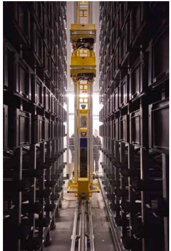
Regalbediengerät mit übereinander montierten Lastaufnahmemitteln (20.01.2010,)

vorgesehenen Photovoltaik-Anlage mit einer Leistung von 162 kWp und einem Jahres-Energieertrag von 142'000 kWh erreicht dieser Teil des Baus den Schweizer Minergie-P Standard.