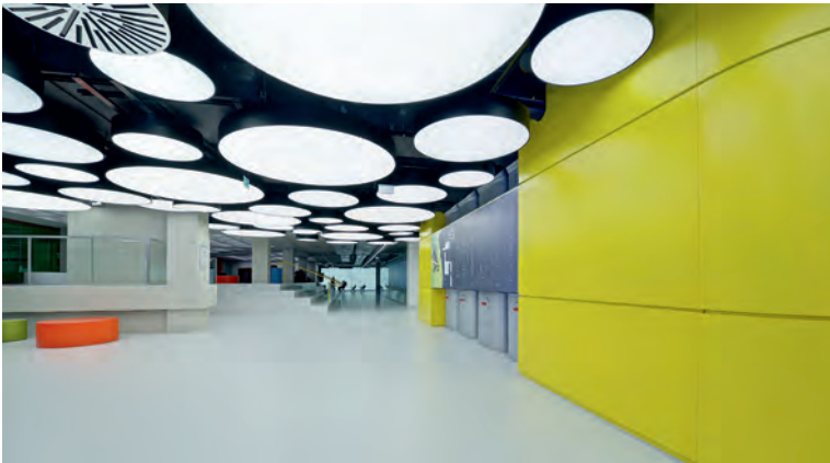
Abb. 1: Info-Zentrum der sanierten Bibliothek der Universität Konstanz