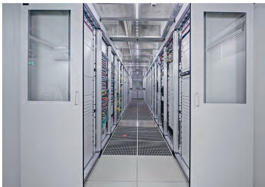
Abb. 4: Neues Data centre der Universität Konstanz

Während der verschiedenen Reorganisationsprozesse im KIM in den letzten Jahren wurden parallel immer auch Geschäftsprozesse analysiert, angepasst und optimiert. Auch nach der neuerlichen Veränderung zu Beginn des Jahres 2020, mit der ein großer Schritt auf dem Weg hin zu einem integrierten IT- und Bibliotheksdienstleister erreicht werden konnte, stehen noch umfassende Prozessveränderungen an. Diese werden sowohl in internen Bereichen (z.B. IT-Sicherheit oder IT-Governance) als auch an den Schnittstellen zu den Kund/-innen (z.B. First und Second level support)