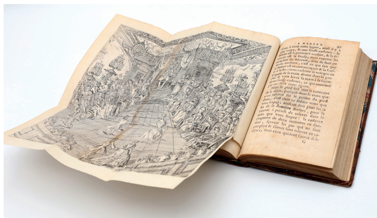
Abb. 3: Herausforderungen bei der Digitalisierung historischer Bücher: fragile Faltblätter