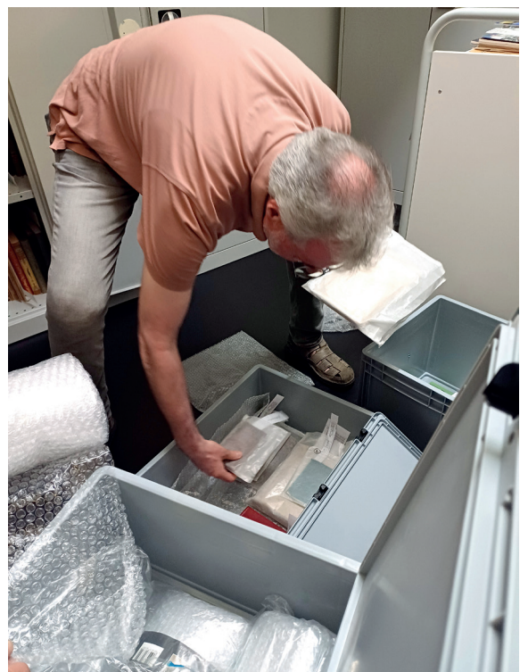
Abb. 4: Mitarbeiter des mit der Digitalisierung beauftragten Technischen Zentrums für Digitalisierung des LVR-Archivberatungs- und Fortbildungszentrums kümmern sich um die fachgerechte Verpackung und den sicheren Transport der wertvollen Rara.

bereit (Abb. 4). Für Transport und Lagerung seltener Bände ist eine klare Versicherungslage essenziell.