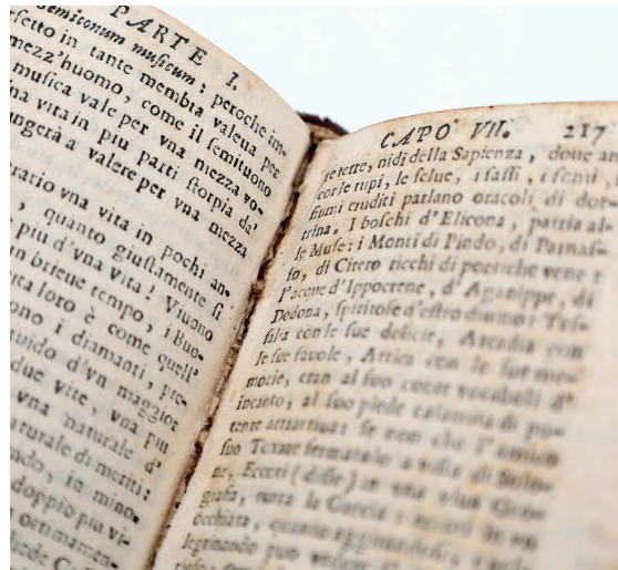
Abb. 1: Herausforderungen bei der Digitalisierung historischer Bücher: äußerst eng an die Bindung gedruckter Texte.