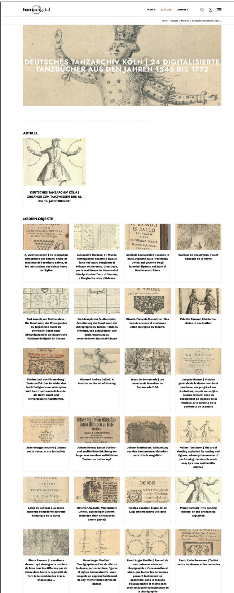
Abb. 6: Für eine erste Veröffentlichung auf der Online-Plattform tanz:digital wurden zunächst nutzungsorientierte PDF-Derivate erzeugt.